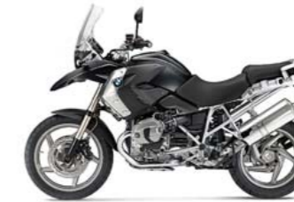
Triple Black Saphirschwarz metallic/ Motor schwarz