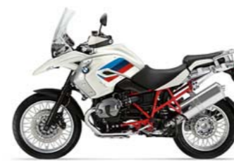
Rallye Alpinweiß uni/Rahmen Magmarot

Auch die zusätzlichen Ausstattungsmöglichkeiten von ABS bis Zusatzscheinwerfer lassen kaum Wünsche offen. Der Soziuskomfort ist für eine Reise-Enduro außergewöhnlich. In der R 1200 GS steckt Fahrspaß pur – allein oder zu zweit. Wer ein stimmiges Gesamtkonzept mit unverwechselbarer Ausstrahlung sucht, kommt an ihr kaum vorbei.