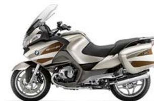
Lightmagnesium metallic/ Magnesiumbeige metallic